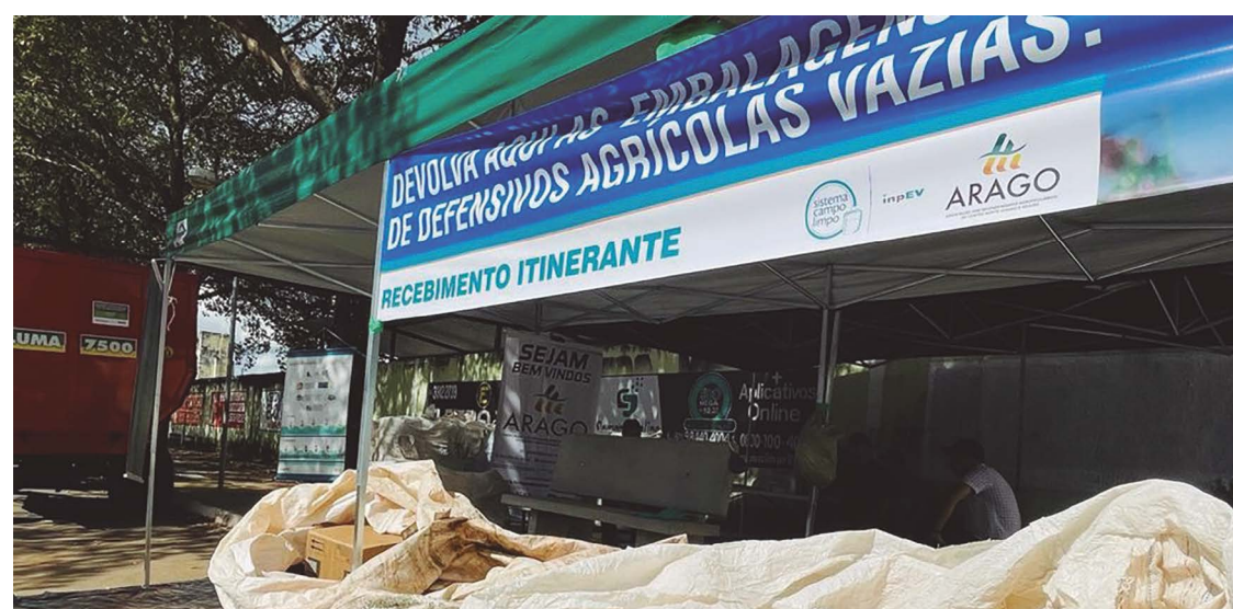
Postos itinerantes fazem o recolhimento de embalagens e reduzem as dificuldades dos produtores rurais

No período de 2021 a 2022, segundo dados da ecoeficiência do sistema, foi efetivada economia de energia suficiente para abastecer 5,2 milhões de casas durante um ano. Foi evitado o correspondente a 16 mil viagens em torno da terra realizadas por um caminhão. Além de serem evitadas emissões de 899 mil toneladas de CO 2 no ambiente.