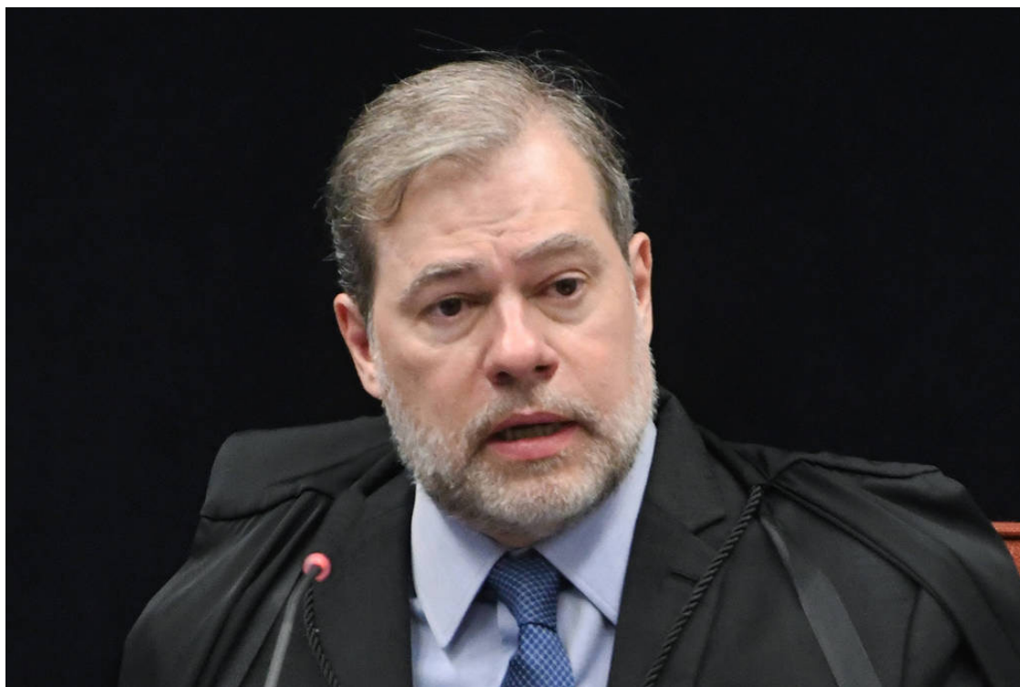
Dias Toffoli: nula as provas sobre pagamentos de propina pela Odebrecht para políticos

A reclamação que motivou a decisão do ministro foi feita