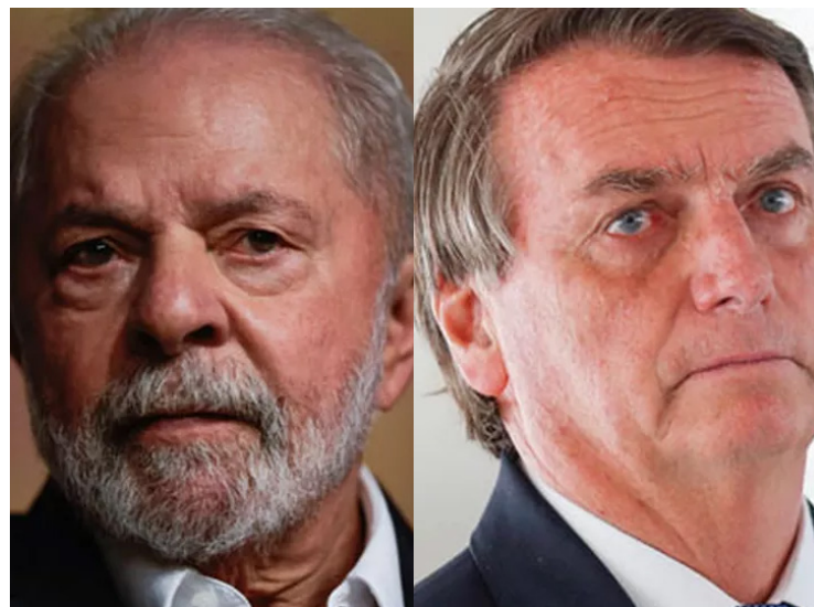
Lula da Silva e Jair Bolsonaro: avaliação do petista é melhor do que a do ex-presidente

Em relação ao sentimento que as pessoas têm em relação aos dois líderes políticos, a pesquisa revelou que 59% dos entrevistados dizem sentir “esperança” em relação a Lula, enquanto 34% afirmam o mesmo sobre Bolsonaro. Por outro lado, 55% associam Bolsonaro à “decepção,” enquanto 40% fazem a mesma associação com Lula.