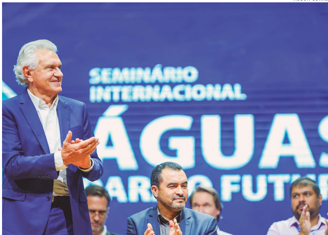
Governador Ronaldo Caiado durante abertura do Seminário Internacional Águas para o Futuro, em Rio Quente

Caiado pontuou o pioneirismo de Goiás em propor ações concretas, capazes de aliar a mitigação dos impactos ambientais com o desenvolvimento econômico. “É uma estratégia de longo prazo, um plano de Estado em que a gente pretende, de fato,