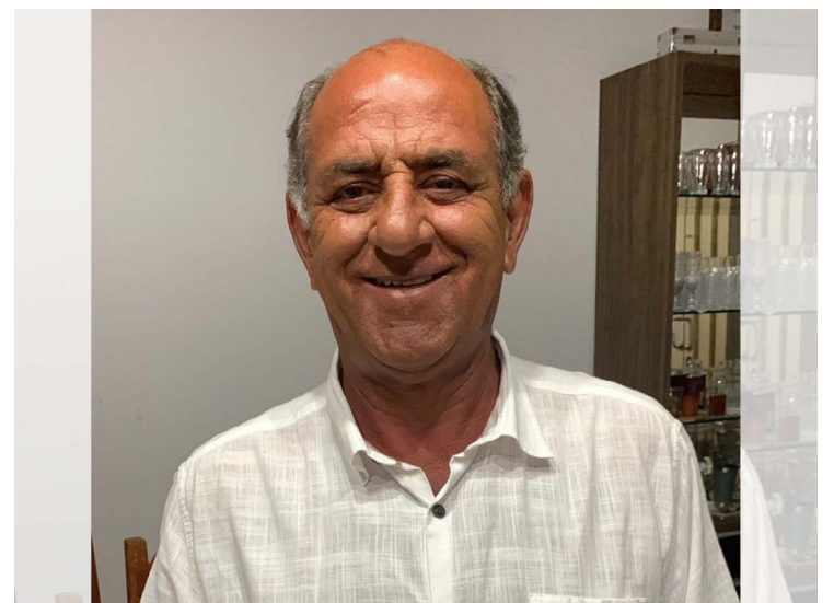
José Ruy: vandalismo em Brasília