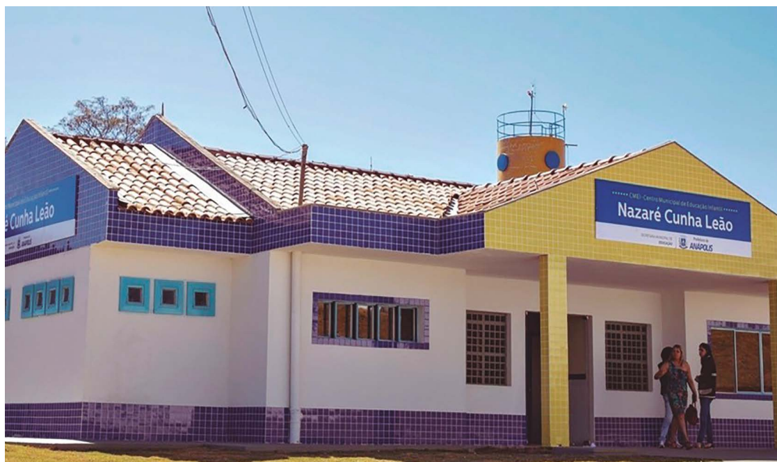
Nova redação da lei define início da contagem de três reeleições dos gestores a partir de 20 de julho de 2022

“Essencial à segurança jurídica é a clareza das leis, que devem ser redigidas de forma a evitar ambiguidades, obscuridades ou contradições, facilitando a sua compreensão e aplicação pelos destinatários e reduzindo os conflitos e as demandas judiciais”, escreve os vereadores da Mesa Diretora na