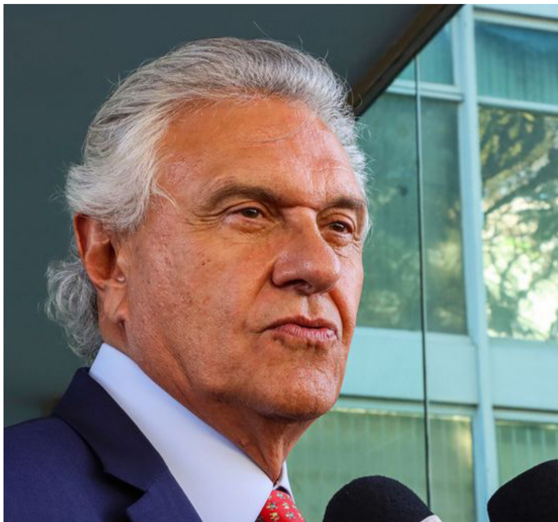
Ronaldo Caiado: eleições serão tratadas apenas no ano que vem pelos partidos aliados

Em relação à sua atuação como presidente do União Bra-