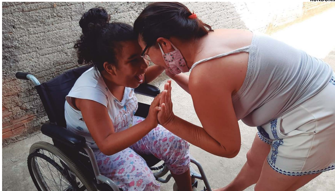
Mesmo com o avanço nas políticas de inclusão, muitas mães enfrentam desafios que afetam sua saúde mental

A parlamentar destaca que a promoção de grupos de apoio e