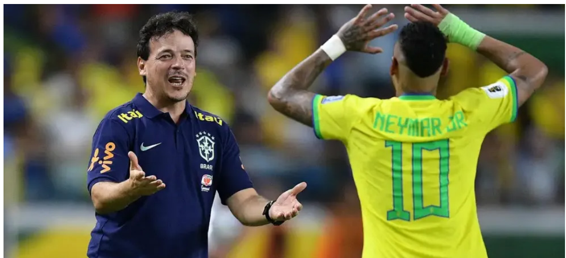
Estreia de Fernando Diniz como técnico foi marcada por uma goleada de 5x1 sobre a Bolívia

Devido ao bom resultado do último jogo, o técnico Fernando Diniz deverá repetir a escalação usada contra a seleção da Bolívia.