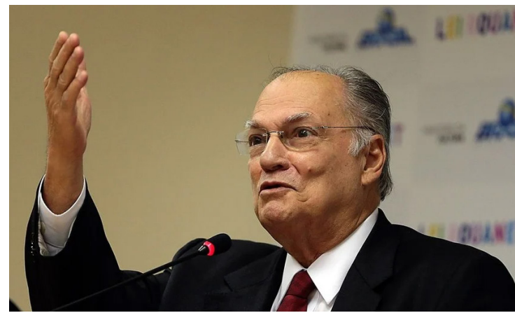
Roberto Freire: saída do comando do Cidadania