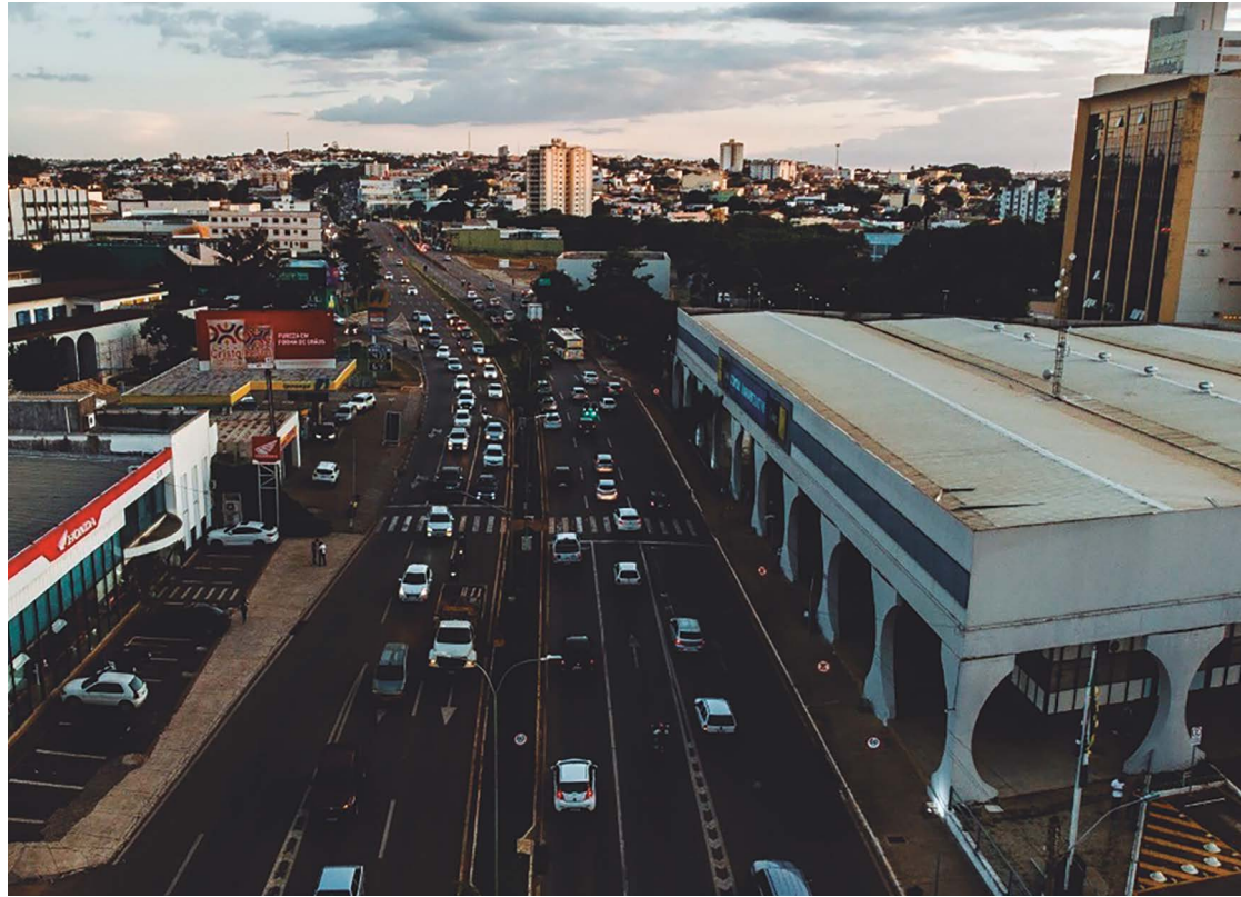
Áreas de maior investimento são Saúde, com reserva de R$ 471,6 milhões e Educação, com R$ 445,9 milhões

A LOA reserva R$ 74.814.806,43 para a Assistência Social e R$ 26.936.000,00 para a Segurança Pública. São R$ 249.369.308,52 para a Previdência Social; R$ 38.806.471,41 para a Habitação e R$ 23.197.410,74 para o Saneamento. O orçamento para a Cultura em 2024 será de R$ 11.679.622,96. Para o