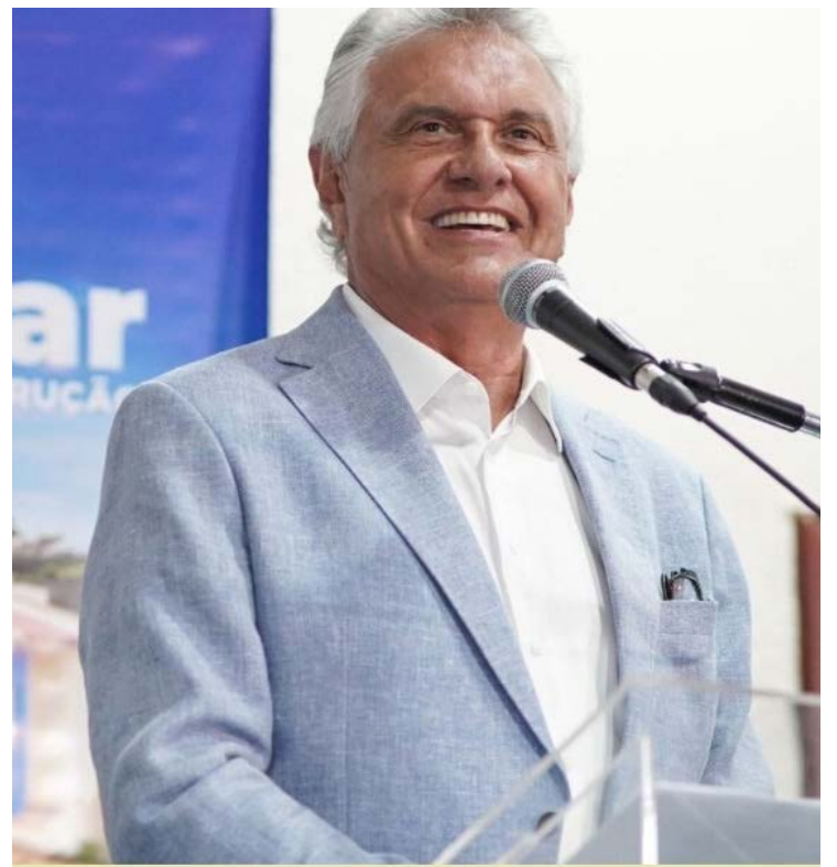
Ronaldo Caiado entrega hoje moradias para moradores de São João da Paraúna: gestor interiorizou políticas de moradia em Goiás

Numa época em que o "Minha Casa Minha Vida" debate atender até mesmo a classe média alta, Caiado optou por focar em quem apresenta ren-