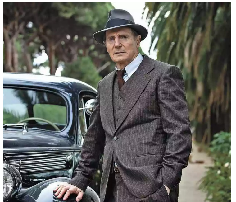
Los Angeles, 1939: ator Liam Neeson vive detetive em filme que chega ao catálogo da Amazon Prime

Corpo em Chamas (Netflix). Um corpo carbonizado é encontrado no porta-malas de um carro num reservatório espanhol. A principal suspeita é a namorada, mas ela acusa o ex-marido - que, por sua vez, acusa o amante dela. Entre momentos de tensão na investigação policial e memórias obscuras que vêm à tona, tenta-se desvendar o crime ao longo da série.