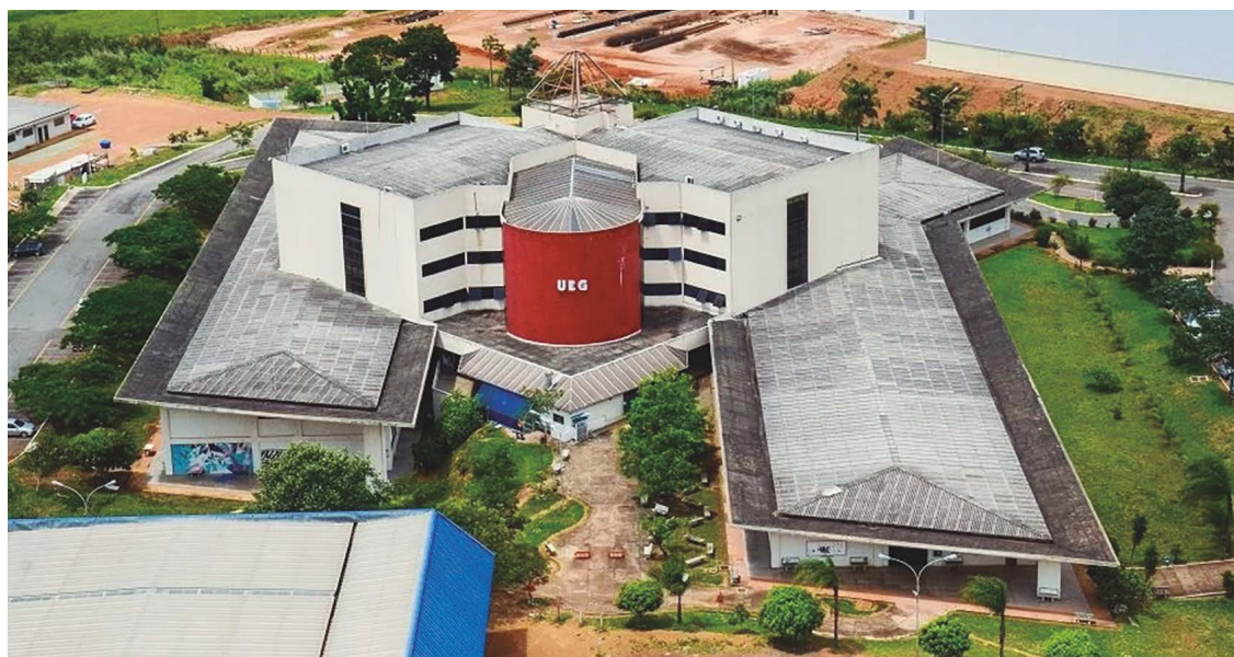
Ambev reforçara interesse de ampliar as operações em Anápolis, mas aguardam regras dos incentivos fiscais

De acordo com o Anuário Goiás (2023-2024), levantamento realizado pelo Jornal O Popular, Anápolis é a segunda cidade do estado de Goiás com mais instituições de ensino superior, 11 no total, ficando atrás apenas da capital, Goiânia, que possui 34. Entre as unidades mais co-